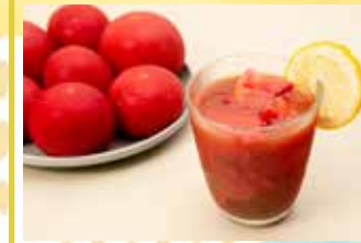
胡椒ウォッカと完熟トマトの氷結ブラッディメアリー

トマトジュースは立川産の完熟トマトでつくったお手製生搾りジュース。氷のかわりに氷結トマトを使用したトマトづくしの贅沢なカクテルです。