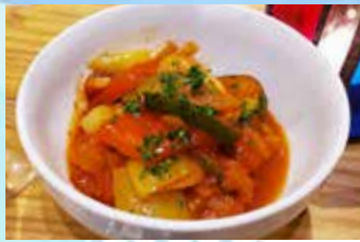
夏野菜をふんだんに使った ラタトゥイユ

パプリカ、ズッキーニ、ナスなどふんだんな夏野菜のラタトゥイユを使った「ラタトゥイユ・チキンボウル」や、クラフトビール各種、おつまみなどをご提供します。