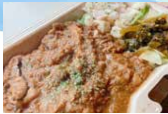
無水子キンカレー