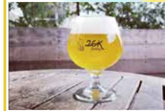
アセロラサワーエール

サワーエール酵母を使用し、甘さを抑えたフルーティなビールに仕上げました。他にも個性的なビールをご用意してお待ちしております！