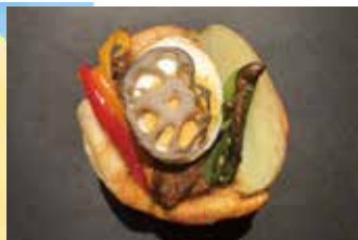
夏野菜のスパイシーカレーパン

本格キーマカレーに地元の夏野菜をたっぷり乗せた冷やしても美味しいカレーパンです。国産小麦、天然酵母、瀬戸内の天然海水塩と素材にこだわって手づくりしています。スパイシーな夏のカレーをお楽しみください。