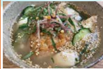
焼きおむすびの冷やし茶漬け

焼き味噌と薬味、擦り胡麻と出汁で炊いた焼きおむすびで香ばしく仕上げました。夏の香りをお召し上がりください。