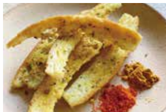
辛口カレーのスティックラスク

独特な味わいの「中東スパイス香るデュカのスティックラスク」、スパイシーな「爽快！辛口カレーのスティックラスク」、濃厚な風味が口いっぱいに広がるガーリックバターofスティックラスク。